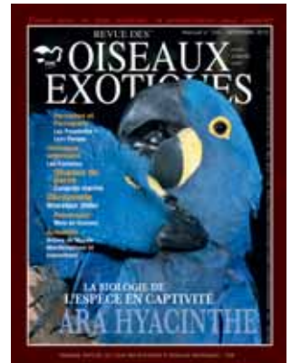
Ara hyacinthe

Rédaction : 02 40 01 04 24 Abonnement : 03 21 41 11 23